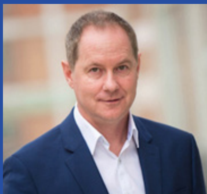
Petr Gazdík, poslanec

a zastávám názor, že kombinace toho nejlepšího z obou návrhů má šanci exekuční prostředí skutečně narovnat. Nejskloňovanějším prvkem je tzv. teritorialita. To znamená, že si věřitel nebude už exekutora vybírat, a ten bude přidělován automaticky na základě systému dle obvodů soudních krajů. Dojde tak k narovnání nezdravě konkurenčního prostředí. Ovšem to není to jediné. Prosazujeme mnoho dalších změn. Předkládáme například návrh na nezabavitelné daňové bonusy nebo například to, aby exekutor mohl vstoupit do obydlí povinného v jeho nepřítomnosti pouze s doprovodem Policie ČR. Řeší se například i zastavování starých exekucí, na které se nepodařilo ničeho vymoci nebo problematika chráněného účtu. Dále pokračujeme i mimo tuto novelizaci v zastavování nezákonných exekucí. Rozhodně vás budeme o všem informovat i nadále a v případě jakýchkoliv dotazů v této oblasti budu rád za jakékoliv podněty, které můžete psát přímo na můj email farskyj@psp.cz .