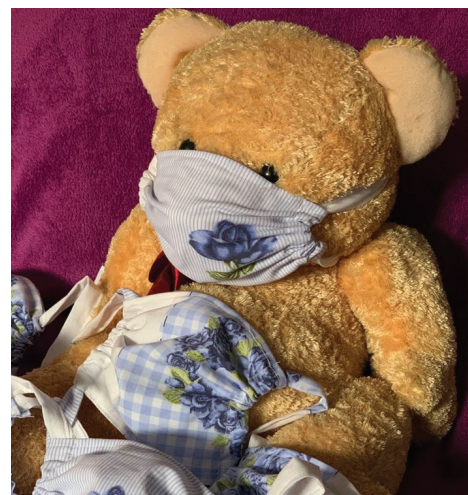
Nikdy by mě nenapadlo, že šítí roušek mě pohltí natolik, že zapomenu jít spát. Děkuji všem, kteří pomáháte také šítí roušky a věnujete je potřebným.