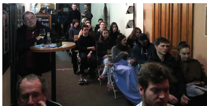
Diváků se v Salse sešlo několik desítek.

V Salse jste také mohli zhlédnout výstavu kreseb žáků