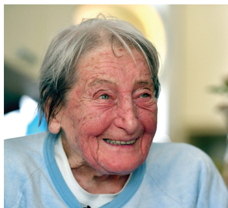
Dana Zátopková (19. 9. 1922 až 13. 3. 2020)

S hlubokým zármutkem jsem se 13. března dozvěděla zprávu o úmrtí oštěpařky Dany Zátopkové, nejstarší české olympioničky, sportovní legendy a také vdovy po nejznámějším českém běžci všech dob – Emilu Zátopkovi. S ním ji pojila nejen láska ke sportu, ale také fakt, že se oba narodili ve stejný den – 19. září 1922. Když se ve 40. letech poznali, brali to jako dobré znamení, které vyústilo nejen svatbou, ale i společným startem na letních olympiádách v Londýně (1948), Helsinkách (1952),