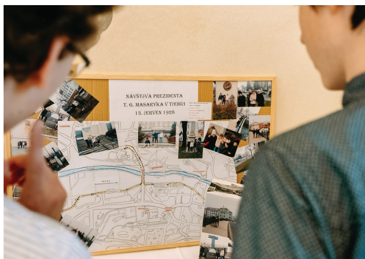
Mapa vytvořená nejmladším týmem, kterou zmiňuji v článku.

Maruško, mohu Tě ujistit, že budeš mít šanci – už jsme totiž s paní Kabelkovou z třebíčské knihovny, paní Padrnosovou