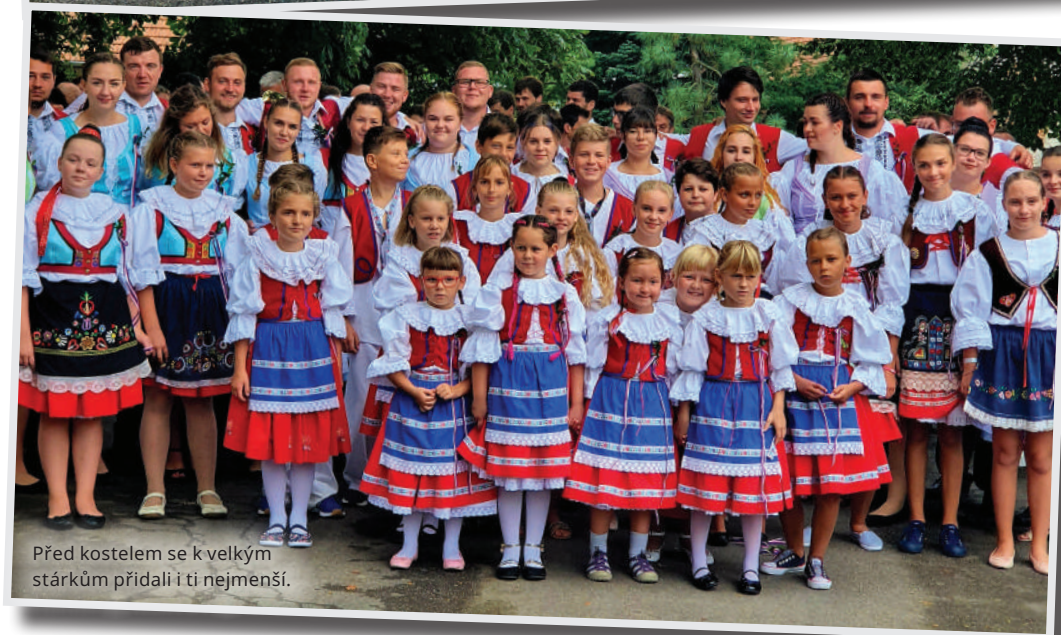
Před kostelem se k velkým stárkům přidali i ti nejmenší.