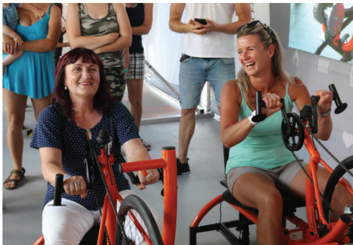
Šlapání na handbících je opravdu náročné.