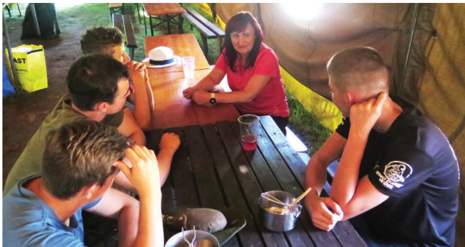
Rozhovor s těmito mladými muži mě velmi obohatil, jsou to lidé na svém místě.