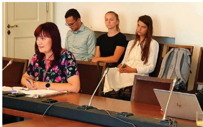
Kromě Istanbulské úmluvy jsme řešili také jednotný trh, v němž vidíme záruku prosperity v Evropské unii i České republice

Zároveň žádáme vládu, aby přijala opatření k řešení problému příjmové nerovnosti žen a mužů v produktivním, ale i v důchodovém věku. S tím souvisí i vytvoření dostatečné kapacity předškolních zařízení. V usnesení dále zdůrazňujeme význam výchovy a výuky etiky a etikety (Úmluvu jsme více probírali na plénu Senátu 20. srpna, viz předchozí strana).