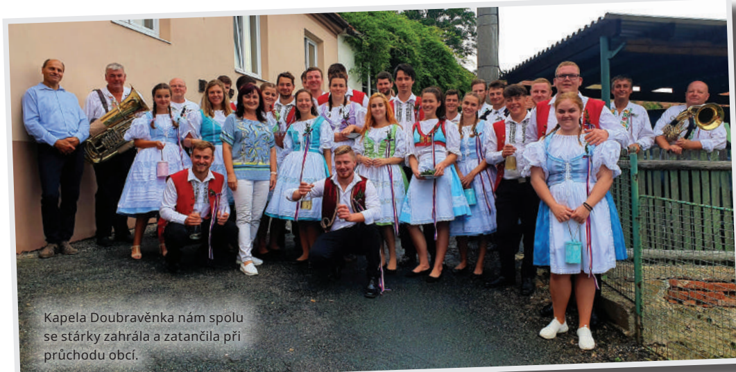
Kapela Doubravěnka nám spolu se stárky zahrála a zatančila při průchodu obcí.

v mém domovském Koněšíně se letos konala v neděli 30. srpna