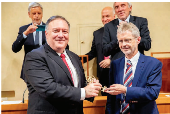
Předseda Senátu Miloš Vystrčil (vpravo) předal ministru Miku Pompeovi symbolický klíč od Senátu.

Šestadvacátá schůze Senátu byla rozdělena na dvě části. V té první jsme: