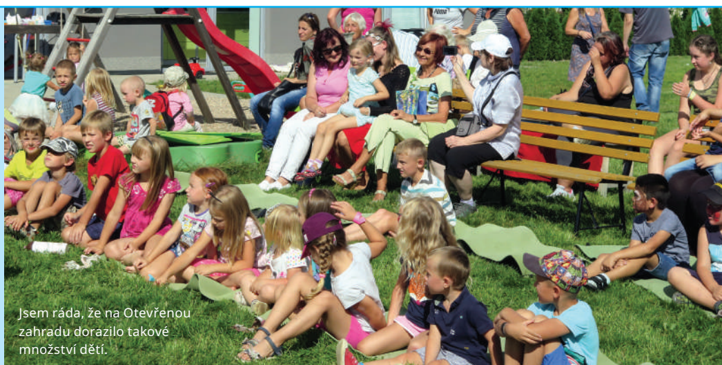
Jsem ráda, že na Otevřené zahradě dorazilo takové množství dětí.

Fotografie a více informací najdete na www.tiny.cc/zahrada .